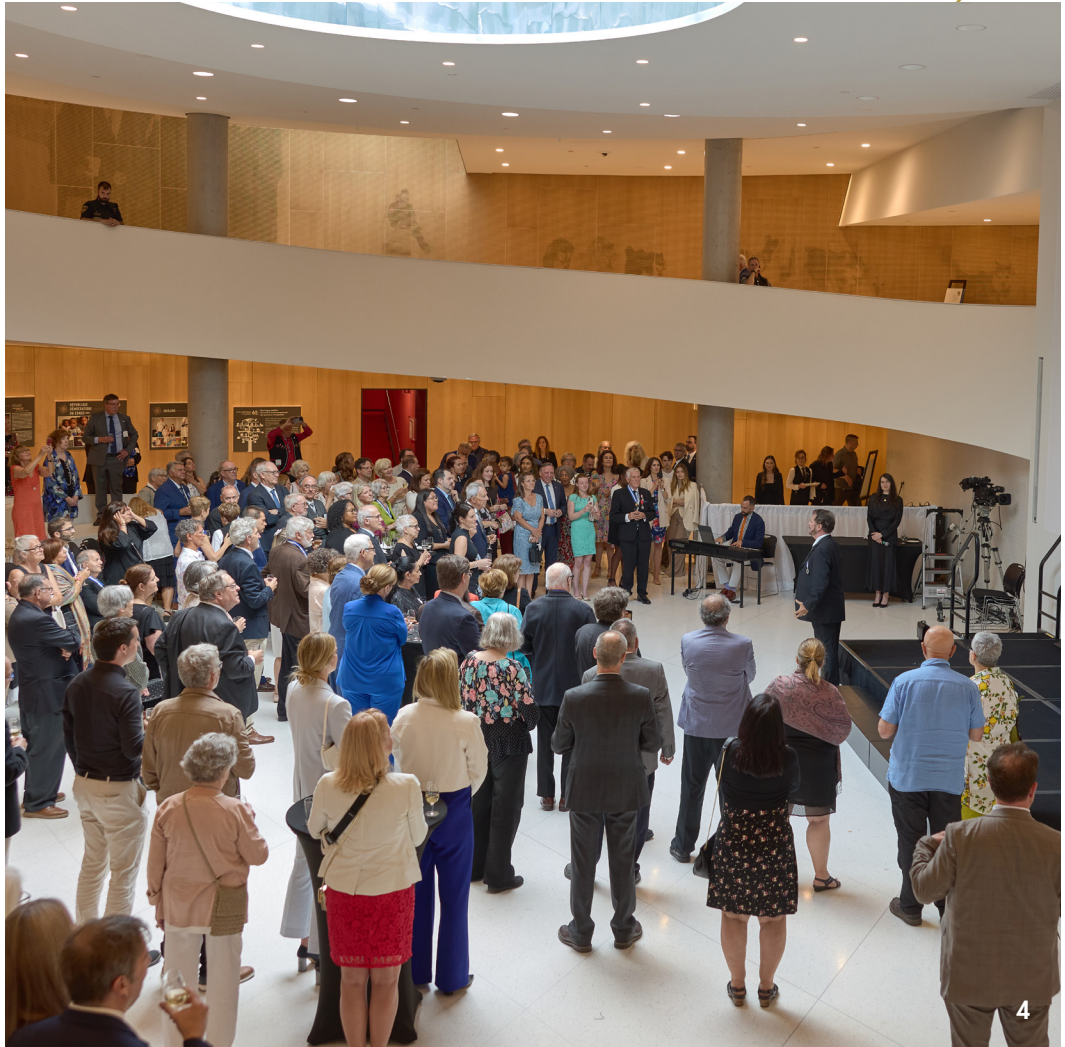
4. L'auditoire médusé devant l'interprétation magistrale de Gino Quilico, C.Q.