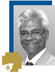
M. NEIL BISSOONDATH, C.Q.